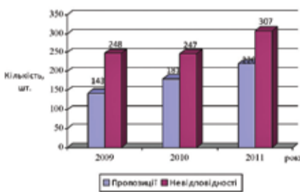
Діаграма 1. Динаміка фіксування невідповідностей, пропозицій протягом 2009-2011 років

Найсуттєвішим аспектом системи управління якістю є впровадження пропозицій про покращення та усунення виявлених невідповідностей, що дає можливість поліпшити діяльність товариства в цілому, вплинути на рівень задоволеності споживачів, на якість послуг, що надаються. Щоквартально відділом управління якістю аналізуються звіти підрозділів товариства про зафіксовані невідповідності та надані пропозиції щодо покращення.